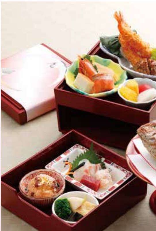
※写真はお子様弁当 5500円のイメージです。