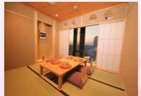
掘りごたつ式個室「粟田口」2名様～4名様

スタッフによる長年培われた料亭ならではの きめ細かな心遣いと確かなサービス。 大切なお時間を過ごすのに大変便利な 個室が大小8部屋ございます。