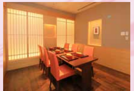
テーブル個室「上七軒」4名様～8名様