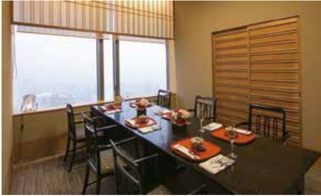
窓側完全個室「祇園町」