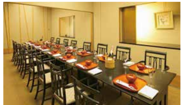
完全個室「先斗町・宮川町」