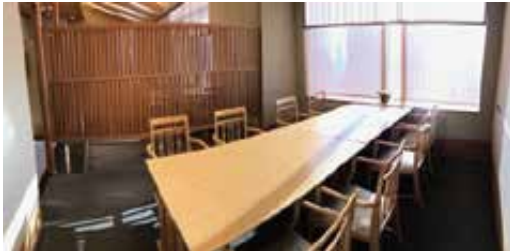
窓側半個室「秋の間」