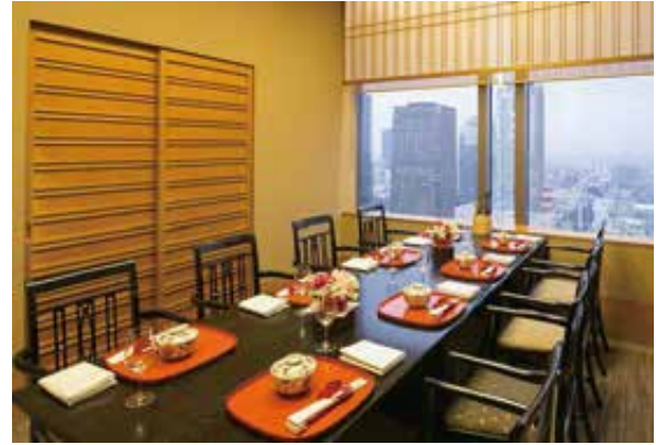
窓側完全個室「上七軒」